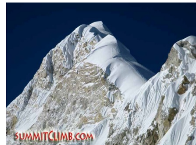
Blick vom West Col auf den Gipfel des Baruntse

18.-19.Tag Es geht vollends hinunter in den Talgrund des Hongu Khola. Bei der sandigen Fläche des Chamlang Basecamp (4820 m) wird genächtigt. Eine letzte halbtägige Etappe führt zum Basislager in einer sandigen Mulde auf 5450 m in der Nähe eines kleinen Sees.