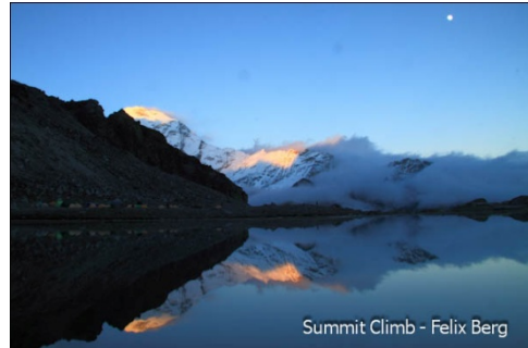
Basislager für den Mera Peak

11.Tag Es geht weiter bergauf. Eine kurze Tagesetappe führt nach Khare (4870 m), letzter flacher Platz vor dem Mera La und kurz unterhalb des Mera Gletschers. Mera Peak und Kusum Kanguru säumen die Aussicht.