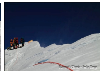
Tunc Findik, SummitClimb Teilnehmer, 2008 auf dem Gipfel - der steile Gipfelgrat - Teilnehmer & Sherpas 2010 auf dem Gipfel des Baruntse.