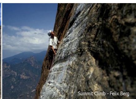
Bilder (l.n.r.): Auf dem Nelion (5189), Normalweg zum Nelion, Abseilen (Standardroute), Klettern in Kenia.