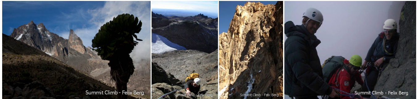
Links: Mount Kenia Südseite, rechts auf dem Normalweg zum Nelion

Klettern: Die Hauptgipfel Nelion (5188m) und Batian (5199m) können eigenständig mit Partner oder mit einem Bergführer bestiegen werden. Mit Kletterrouten ab dem 4. UIAA Schwierigkeitsgrad bis zu extremen Abenteuer-Routen bieten die bis zu 700 Meter hohen Wände ein Felskletterparadies aus bestem Gneis Gestein.