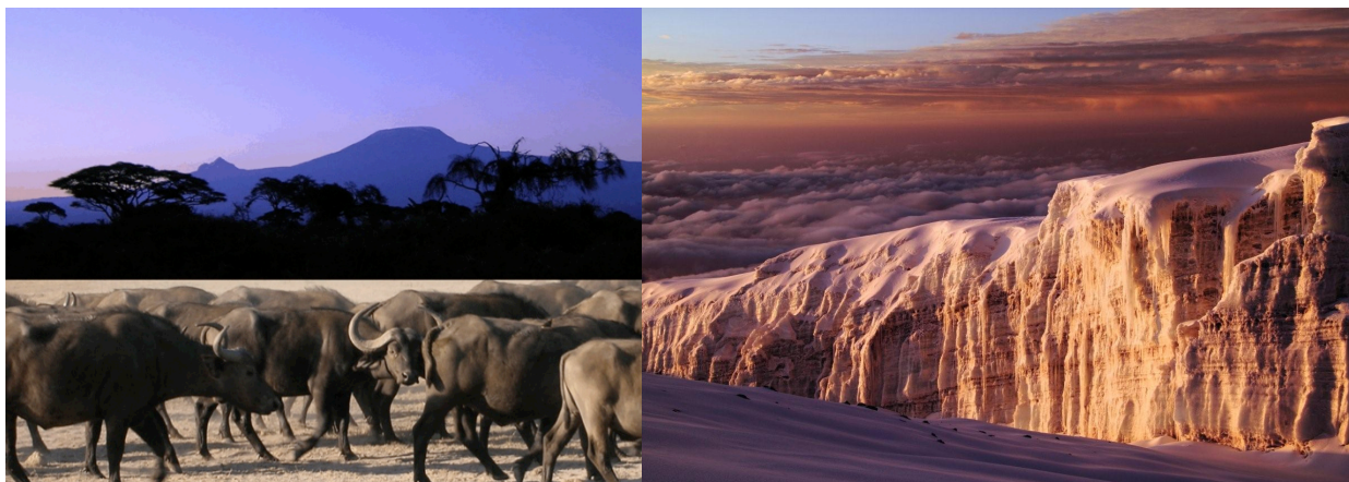
Bilder: Kilimandscharo, Büffel in der Savanne, Gletscher am Gipfel des Kilimandscharos – alles in einer Reise.

SummitClimb Naturerlebnis in Tansania, Trekking zum höchsten Berg Afrikas