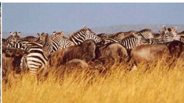
Zum Schutz vermischen sich in den großen Herden Zebras und Gnus.