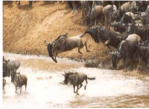
Gnus, Mara Fluss

Die Masai Mara, der nördliche Ausläufer der Serengeti, ist das tierreichste Naturschutzgebiet Kenias. Einmal jährlich bietet sich hier das unvergleichliche Naturschauspiel der großen Gnu Wanderung auch unter dem Begriff Migration bekannt. Bis zu 2 Millionen Gnus ziehen in der Zeit von Juli bis Oktober in endlosen Ketten auf der Suche nach neuen Weidegründen durch die Masai Mara. Mit ihnen ziehen hunderttausende Zebras sowie Antilopen. Für die Fleischfresser eine üppige Zeit. Am beeindruckendsten ist die Überquerung des Mara Flusses. Oft gelingt es uns dieses Spektakel mitzuverfolgen - garantiert werden kann es nicht.