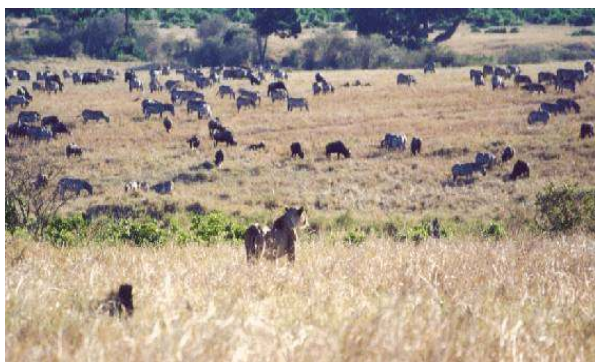
Üppige Zeiten für Fleischfresser: Eine Löwin verfolgt eine Herde.