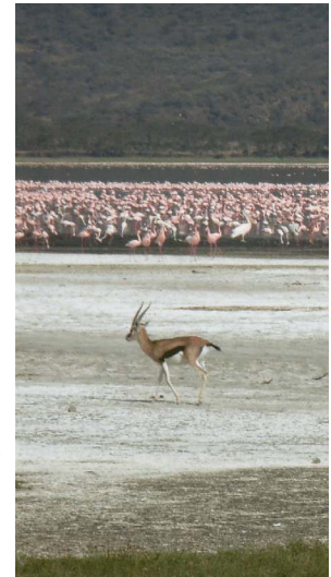
Thompsons Gazelle am Nakuru See

Heimflug oder Direktflug an die Küste an ein Strandhotel in Mombasa oder Watamu .