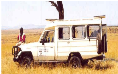
Wir benutzen spezielle Safarifahrzeuge

Hoch führt die Strasse zum Ngorongoro Kraterrand, vorbei am Denkmal von Michael und Bernhard Grzimek und leicht runter durch eine phantastische Landschaft zur Oldupai Schlucht. Lernen Sie in dem dortigen Museum über unsere Herkunft. Picknicklunch. Weiterfahrt ins Herzen der Serengeti, wo Sie von der Mannschaft, die bereits das Camp für Sie aufgebaut hat, erwartet werden. Übernachtung auf privater Campsite.