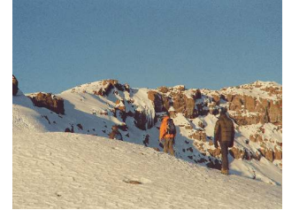
Auf den letzten Metern zum Gipfel

Hoch führt die Strasse zum Ngorongoro Kraterrand, vorbei am Denkmal von Michael und Bernhard Grzimek und leicht runter durch eine phantastische Landschaft zur Oldupai Schlucht. Lernen Sie in dem dortigen Museum über unsere Herkunft. Picknicklunch. Weiterfahrt ins Herzen der Serengeti, wo Sie von der Mannschaft, die bereits das Camp für Sie aufgebaut hat, erwartet werden. Übernachtung auf privater Campsite.