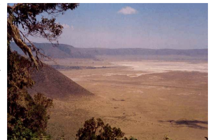
Caldera des Ngorongoro Craters