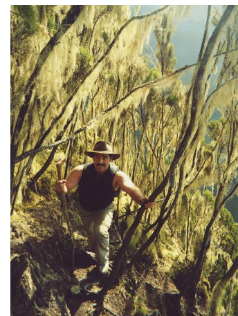
Wanderung durch Giant Heather Pflanzenwelt