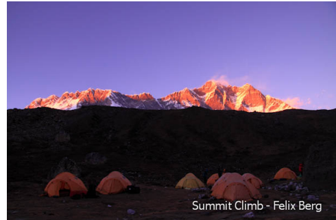
Chutanga Camp mit Blick auf die Lhotse.

29.Tag Für die Runde zurück durch das Khumbutal folgt nun die technisch anspruchsvolle Überquerung des 5850 Meter hohen Amphu Laptsa Passes und der Abstieg nach Chukkum (Chukkung). Einige Stellen versichern wir mit Fixseilen. Ein wilder und eindrucksvoller Weg mit Blick auf die Lhotse Südwand endet bei einem wunderschönen Zeltplatz namens Chutanga (1 Std. vor Chitunga), Zelt ÜN/HP.