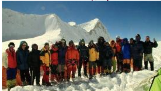
SummitClimb Team im 1.Camp, Bayerische Teilnehmer am Gipfel (Bilder unten, 2010 Expedition)

Ab hier stehen ganze 8 Tage zur Verfügung, um gut vorakklimatisiert zum Hochlager auf 6143 M.ü.M (Camp I) am West Col aufzusteigen und von dort gegebenenfalls mit Zwischenlager auf 6420 M.ü.M (Camp II) zum Gipfel aufzubrechen. Der abschließende Südwestgrat ist ausgesetzt, wird aber mit Fixseilen versichert. Über den Abbruch in die Westwand ist der Hänge längere Passagen 45° steil und nach Osten überwächtet. Einige Steilstellen können bis zu 75° erreichen. Hochlager Camps - Zelt ÜN/HP.