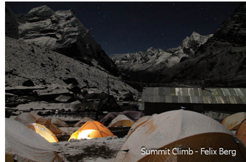
Camping, Khare bei Nacht